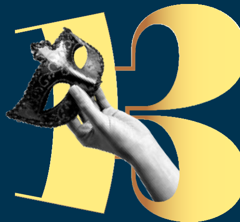
Un ballo in maschera