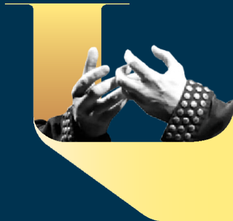
La battaglia di Legnano